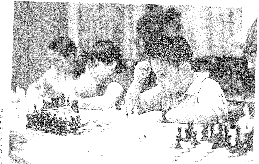
Los más jóvenes fueron los protagonistas del trono de El Olivar. MAITE SANTONJA

Ayer, el río Ebro fue el protagonista con el XIV Trofeo CAI Ciudad de Zaragoza de yolas, evento que organizaba la Territorial de remo con la colaboración del Centro Náutico de Vadorrey, Zaragoza Deporte Municipal y el patrocinio de Caja Inmaculada. El Puerto Fluvial de Vadorrey fue el punto de partida de la cita que reunió a remeros de distintas comunidades autónomas que ofrecieron un