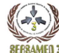
Sociedad Española de Rescate, Salvamiento y Socorrismo, Medicina de Intervención en Emergencias, Catástrofes y Desastres